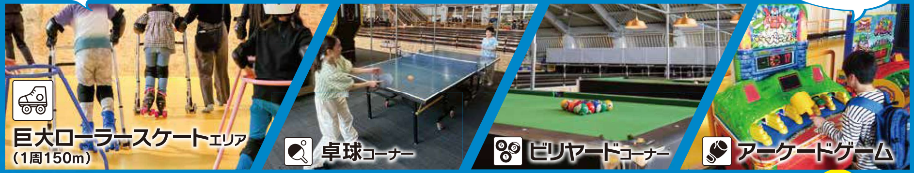
巨大ローラースケートエリア (1周150m)